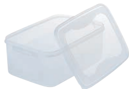
⑪めか漬 シール容器 角

外寸:158×220×H145 容量:4ℓ 材質:本体/ポリプロピレン 蓋/ポリエチレン ●純銀の効果「ミューフアン」から発揮される銀イオンで 永続的な抗菌効果 ●製品表面の大腸菌、黄色ブドウ球菌を無加工品に比 べて99%以上抑制 ●食パンの保管やめか漬けに最適