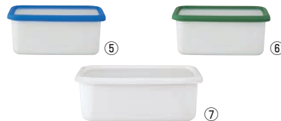
コンテ ホーロー容器

材質:本体/ホーロー用銅板 蓋/ポリプロピレン、エラストマー 表面のガラス質は汚れが付きにくく、におい移りも少ないので、キムチなどの発酵性食品のほかさまざまな食材のストックが可能。耐熱性が高いためオープンでの調理にもお使いいただけます。 ※オープンでご使用される際は蓋を外してください。