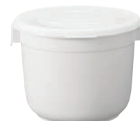
⑯トンボ めか漬シール 朝市8型