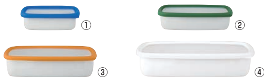
コンテ ホーロー容器