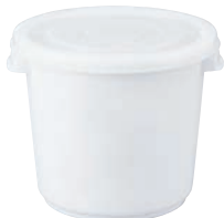
⑭シールストッカー

材質:本体/ポリプロピレン 蓋/ポリエチレン ●臭い漏れを防ぎ、台所でも安心してお使いいただけます。