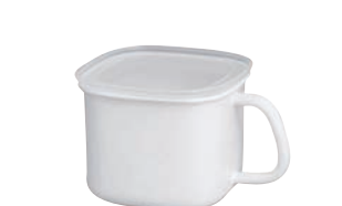
⑧ホーロー 角型みそポット