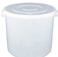
⑮トンボ 漬物シール深型